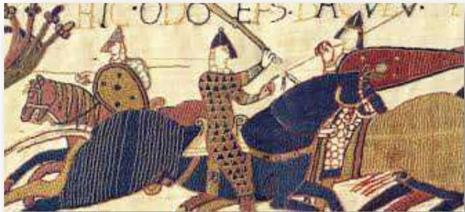
Tapete Medieval Bayeux. Representa en más de 70 escenas la conquista de Inglaterra por los Normandos. De 1476 aproximadamente