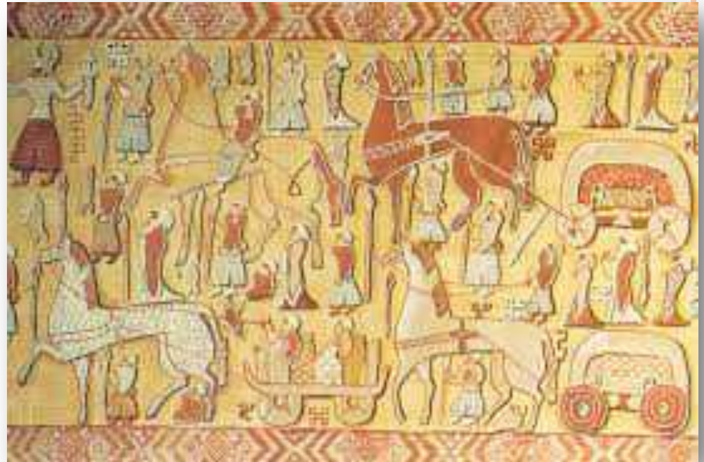
Tapiz de Oseberg. Este tapiz funerario vikingo data de 834 AC aproximadamente.