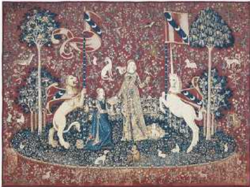
La dama y el unicornio. Tapete medieval francés.